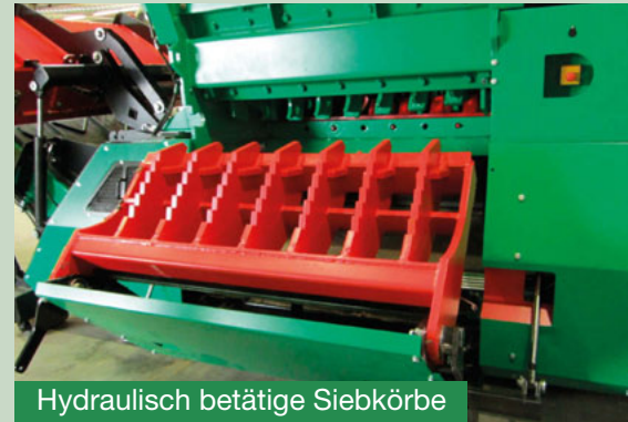
Hydraulisch betätigte Siebkörbe